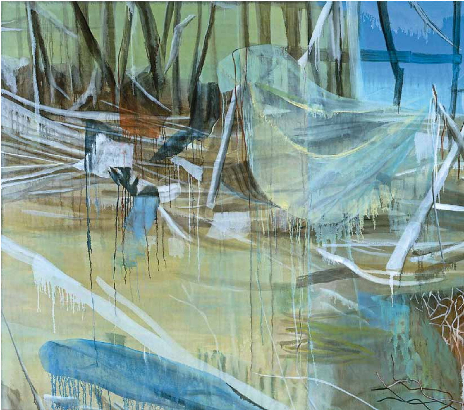
^ Marc Desgrandchamps Sans titre , 2008 Huile sur toile 200 x 450 cm Collection Bernard Magrez Œuvre prêtée au Musée d'Art Moderne de la Ville de Paris