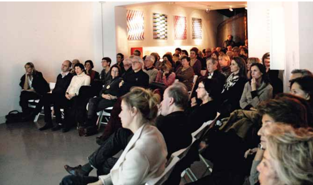
↳ Rencontre au Pavillon du Château Labottière

Rencontres gratuites pour les personnes munies d'un billet d'entrée au Château, uniquement sur réservation.