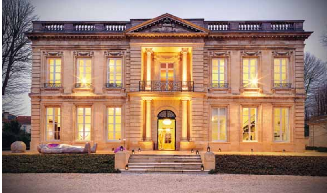
< Château Labottière